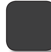
AUTOLIITTO TUMMA HARMAA PMS 432 CMYK 0,0,0,90